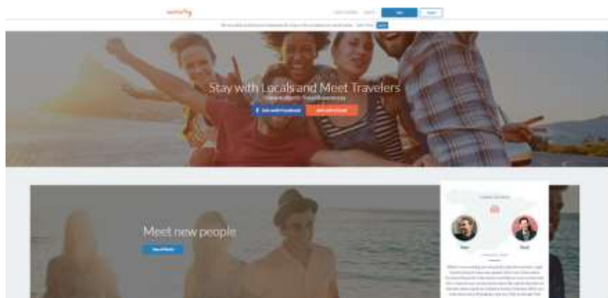
Rajah 1: Laman Jaringan Sosial CouchSurfing