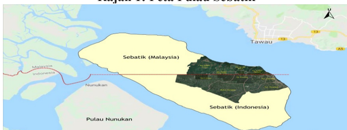
Rajah 1: Peta Pulau Sebatik

Pulau Sebatik merupakan simbiosis asimetri ekonomi di sempadan yang berdaya saing dalam memacu kerencaman geo-politik, ekonomi dan kesejahteraan sosial masyarakat sempadan. 7 Ketergantungan bersifat asimetri ini merujuk kepada Tawau sebagai tumpuan ekonomi utama untuk perdagangan. Di sisi Indonesia melihat Tawau sebagai fokus transaksi dan pasaran utama bagi keluaran sumber perdagangan yang bersifat pertanian, perikanan, agro-pertanian dan produk-produk lain Indonesia untuk didagangkan. Di sisi Malaysia melihat Sebatik sebagai kebergantungan utama masyarakat sempadan Indonesia untuk memperolehi barang keperluan dan produk Malaysia. Kebergantungan Sebatik kepada Tawau menjadi begitu kuat kerana tidak ada pilihan berbanding mendapatkan barangan dan produk keperluan dari Nunukan dan Tarakan di Indonesia yang mahal dan faktor jarak yang jauh.