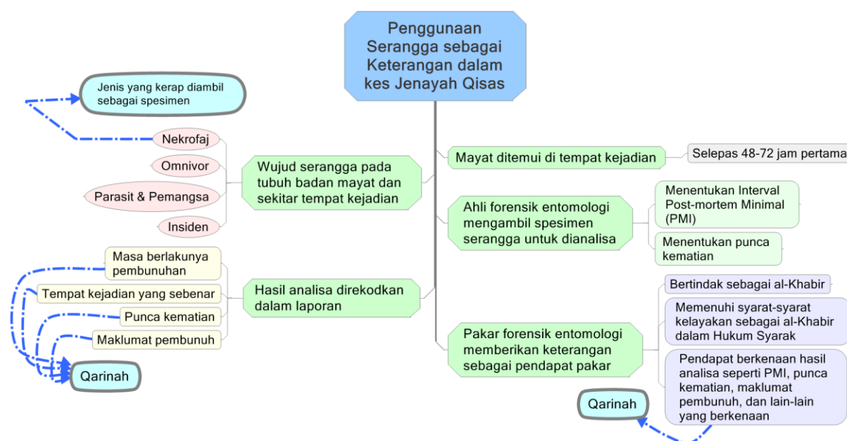
Rajah 1. Penggunaan Serangga sebagai keterangan dalam Kes Jenayah Qisas.

Rajah 1 merupakan carta penggunaan serangga sebagai keterangan dalam kes jenayah qisas untuk mendapatkan maklumat penting bagi sesuatu kes pembunuhan yang telah berlaku. Penggunaan serangga bermula apabila mayat ditemui di tempat kejadian pada tempoh selepas 48 hingga 72 jam pertama. Terdapat kewujudan empat jenis serangga yang boleh ditemui pada tubuh badan mayat dan sekitar tempat kejadian. Namun, jenis serangga yang kerap diambil sebagai spesimen adalah nekrofagus. Kemudian, analisis terhadap serangga ini boleh dilakukan oleh ahli entomologi forensik untuk menganggarkan sela masa kematian minimum atau minimum postmortem interval (mPMI) dan berkemungkinan juga punca kematian. Hasil analisis akan direkodkan oleh pakar entomologi forensik dan diserahkan kepada pihak pendakwaan untuk dijadikan sebagai suatu keterangan dalam perbicaraan kes kesalahan jenayah qisas. Pakar entomologi forensik berkenaan juga boleh dipanggil untuk memberikan keterangan terhadap hasil analisisnya. Keteranganannya akan dikira sebagai pendapat pakar yang juga merupakan keterangan jenis qarinah.