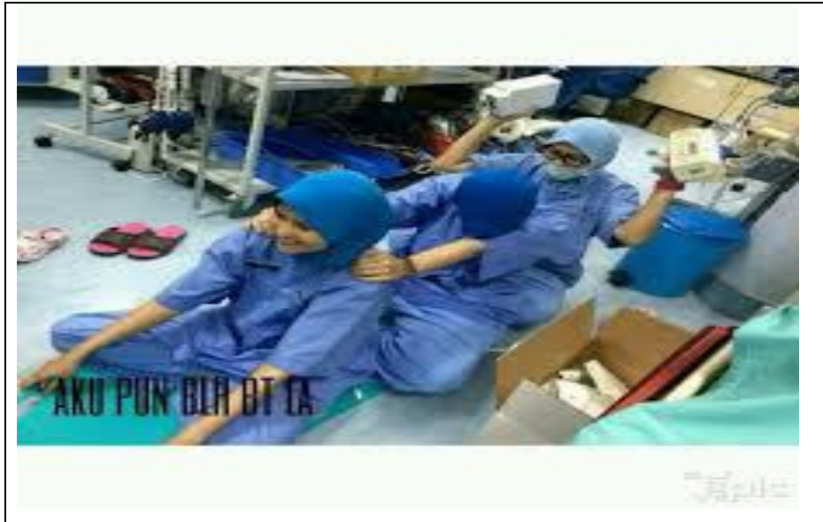
Rajah 2: Meme imej makro kakitangan hospital meniru aksi raja bomoh untuk mencari MH370.

Merujuk kepada meme yang dihasilkan dalam rajah 2 dapat dijelaskan bahawa meme yang terhasil adalah bertujuan untuk mempersendakan tindakan yang telah dilakukan oleh Raja Bomoh dalam mencari pesawat yang hilang tersebut. Berdasarkan kepada analisis kritis wacana terhadap meme tersebut, penyelidik mendapati bahawa meme yang dihasilkan tersebut turut memiliki beberapa elemen-elemen seperti yang ditekankan sebelum ini, iaitu dari sudut teks, praktik wacana dan juga praktik sosial budaya.