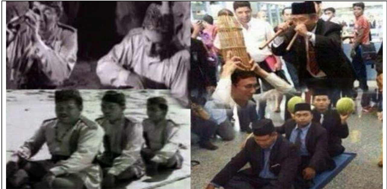
Rajah 1: Meme imej makro raja bomoh Malaysia mencari pesawat MH370 yang hilang

Hasil kajian dan perbincangan dalam kajian ini adalah seperti berikut: