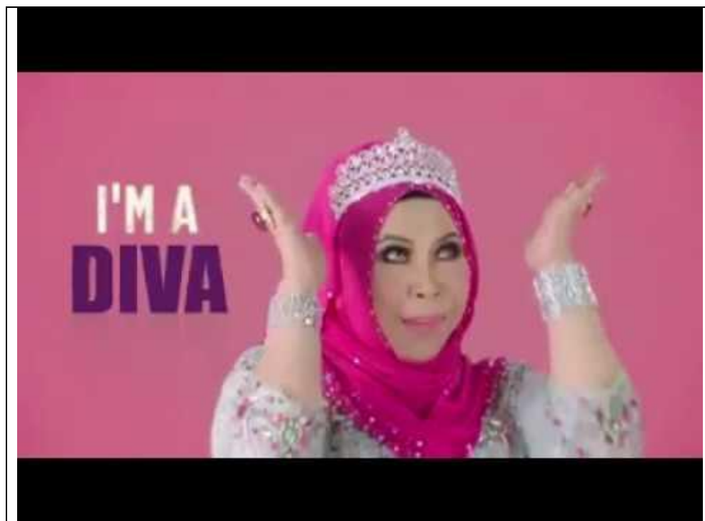
Rajah 5: Meme video mikro (sedutan muzik video asal I AM ME ).

Namun begitu, video muzik tersebut telah ditiru oleh segelintir netizen untuk mempersendakan muzik video asal tersebut. Rajah 6 pula menunjukkan hasil meme Makro ataupun video muzik parodi yang telah dihasilkan oleh sesetengah netizen berhubung dengan isu video muzik tersebut.