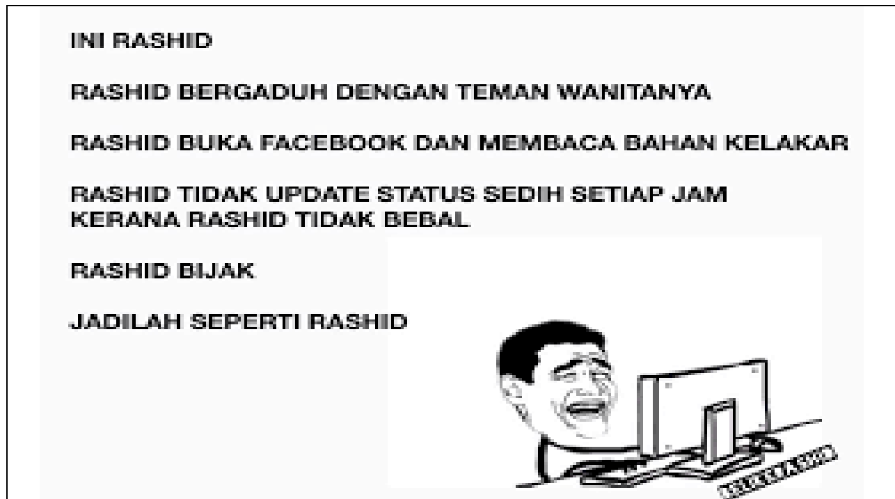
Rajah 4: Meme imej makro 'Jadilah Seperti Rashid'.

Aspek yang ketiga pula adalah praktik sosial budaya. Dalam meme imej makro ini, praktik sosial dan budaya dalam yang ditonjolkan amatlah bertentangan dengan norma masyarakat di Malaysia. Idea ataupun kandungan maklumat yang berbau fitnah dan ghibah tersebut sememangnya bertentangan dengan agama Islam. Selain itu, agama Islam juga melarang seorang lelaki menyerupai seorang perempuan. Keadaan ini sedikit sebanyak telah membawa kepada pelbagai bentuk perbincangan dan perdebatan dalam kalangan masyarakat yang telah menerima meme tersebut.