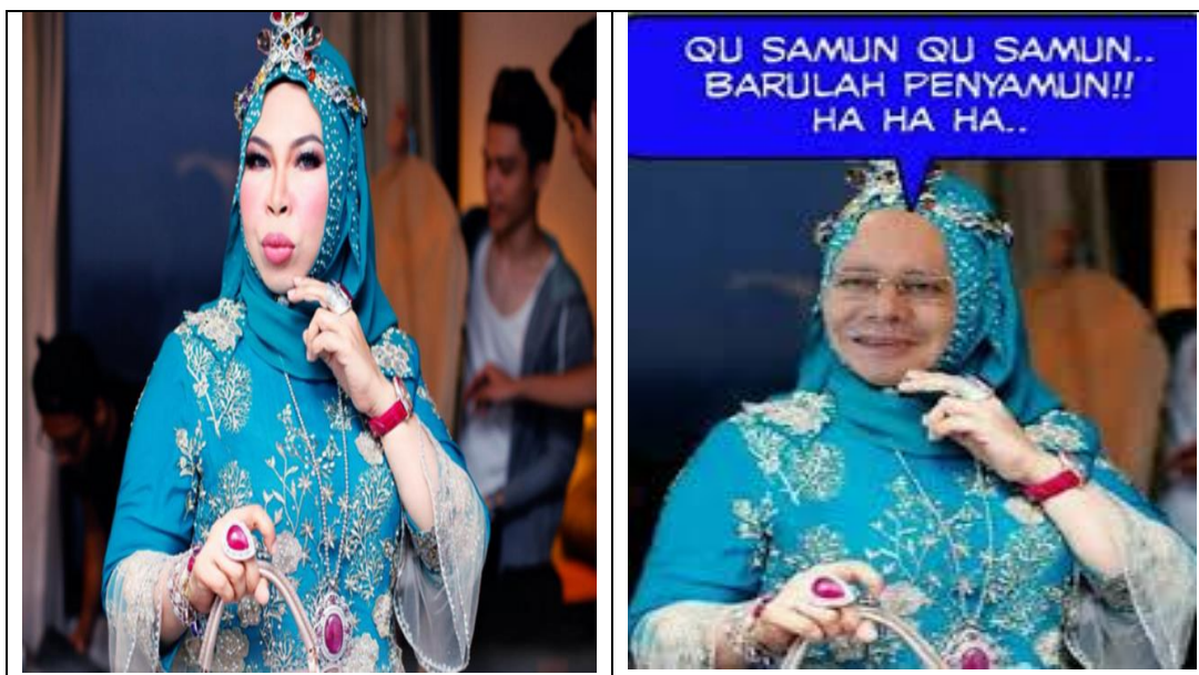
Rajah 3: Meme imej makro perdana menteri meniru pengasas produk Vida Beauty .

Meme ketiga yang telah dipilih oleh penyelidik dalam kajian ini adalah seperti yang telah ditunjukkan dalam gambar rajah 3. Meme Imej Makro tersebut di pilih kerana penyelidik ingin menyatakan bahawa, penghasilan sesuatu meme bukan hanya melibatkan isu dan masalah dalam kalangan masyarakat biasa sahaja, malah kehadiran meme ini juga dilihat turut menasarkankan golongan pembesar ataupun individu yang berpengaruh serta mempunyai kuasa dalam sesebuah parti politik sebagai mangsanya. Meme pada rajah 3 merupakan salah satu meme yang dihasilkan dengan melibatkan pemerintah negara, iaitu Perdana Menteri Malaysia yang keenam iaitu Yang Amat Berhormat Datuk Seri Mohd Najib bin Abdul Razak. Bagi penyelidik, pemilihan meme ini bukanlah bertujuan untuk mengkritik pemerintahan negara ataupun memberi gambaran negatif terhadap kerajaan, namun pemilihan tersebut dilihat sangat relavan dan mempunyai impak yang sangat mendalam bagi membuktikan bahawa penghasilan meme ini juga turut melibatkan golongan pemerintah dalam sesebuah negara.