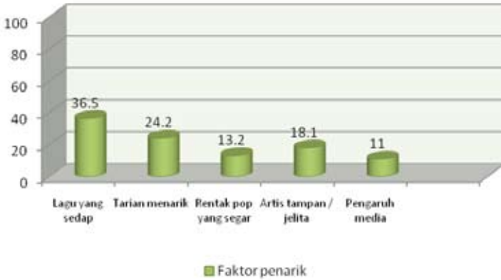
Rajah 3: Pengaruh Musik Korea

Jelas sekali strategi yang diguna pakai oleh pihak Korea dalam mempromosi dan seterusnya mengeksport Hallyu menampakkan hasil yang positif di Malaysia. Ini secara tidak langsung memnatkan lagi sosiobudaya Korea di mata asing. Korea yang dahulunya tidak mendapat perhatian di Malaysia, kini telah menjadi destinasi idaman. Fenomena yang sama berlaku di Thailand, Indonesia, Taiwan, Jepun, China dan banyak lagi negara Asia telah turut melanda Malaysia.