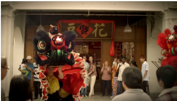
Rajah 2: Tarian singa ditonjolkan di dalam kebanyakan iklan yang dianalisis

Selain itu juga, pengkaji juga mengenalpasti bahawa iklan Tahun Baru Cina Petronas 2012 hingga 2014 mempunyai persamaan dari segi kesenian iaitu pemaparan Tarian Singa. Tarian Singa adalah sebahagian daripada tarian tradisional dalam adat warisan masyarakat Cina, yang mana penari akan meniru pergerakan singa dengan menggunakan kostum singa. Kostum singa itu dimainkan oleh dua penari iaitu seorang di bahagian hadapan dengan mengerakkan kepala kostum, manakala pasangan penari akan berada di bahagian belakang kostum singa tersebut. Kedua-dua penari itu akan bergerak seakan-akan singa di atas pentas yang disediakan.