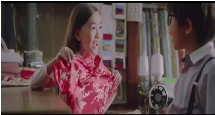
Rajah 5: Iklan-iklan turut memaparkan busana tradisional Cina

Bagi elemen penggunaan busana tradisional, pemaparan busana tradisional masyarakat Cina tidak kelihatan bagi Iklan Petronas 2010 dan 2011, manakala bagi tahun 2012 busana tradisional ini jelas kelihatan apabila seorang wanita sedang membetulkan busana tradisional Cina berwarna merah yang dipakainya iaitu Cheongsam di hadapan sebuah cermin. Demikian juga bagi tahun 2013, elemen busana tradisional sememangnya jelas kelihatan kerana watak utama dalam iklan ini merupakan pasangan suami isteri yang sememangnya berketurunan Cina, rentetan itu ada beberapa adegan di dalam iklan ini yang memaparkan busana tradisional seperti cheongsam dan sam foo kepada khalayak.