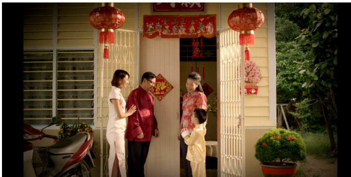
Rajah 4: Hiasan seperti tanglung dan banting jelas kelihatan di dalam iklan

Iklan Petronas 2011 pula, menggunakan latar belakang yang menampakkan zaman sekarang. Namun, ia masih memaparkan elemen budaya Cina, walaupun sedikit sahaja. Contohnya, kelihatan perhiasan jongkong emas semasa seorang lelaki tua sedang memasukan duit ke dalam angpau. Seterusnya bagi Tahun Baru Cina Petronas tahun 2012 hingga 2014 jelas kelihatan ketiga-tiga iklan ini mempunyai persamaan dari segi perhiasan iaitu penampakan banting bertulisan Cina serta tanglung berwarna merah sebagai contoh bagi iklan tahun 2012 kelihatan tanglung dan banting berwarna merah diletakkan di luar rumah pada malam Tahun Baru Cina. Manakala bagi iklan Tahun Baru Cina Petronas 2013 serta iklan Tahun Baru Cina Petronas 2014 kelihatan pemaparan tanglung dan banting berwarna merah yang diletakkan di luar rumah dan deretan kedai sempurna menyambut Tahun Baru Cina.