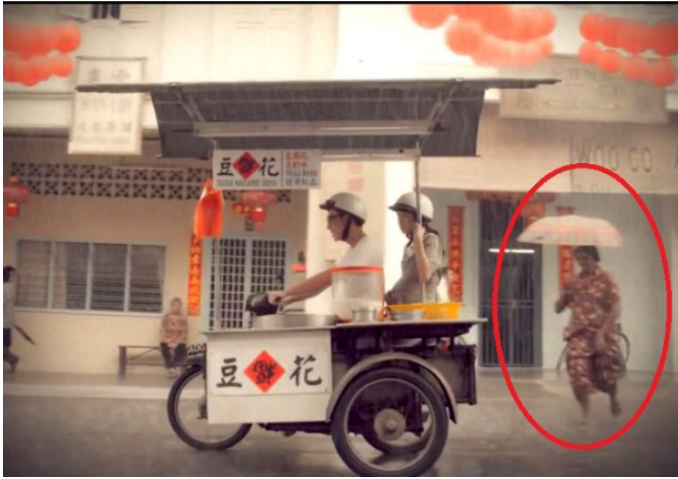
Rajah 7: Contoh pemaparan wanita India di dalam iklan

Iklan 2014 juga wujud pemaparan etnik India di dalam babak sebuah kedai gunting rambut di mana, pengunting rambut tersebut merupakan seorang lelaki berbangsa India.