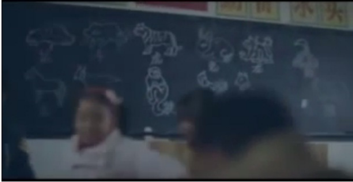
Rajah 3: Lukisan zodiac Cina di papan hitam

Cina sedang melukis gambar 12 zodiak kelahiran Cina di papan hitam.