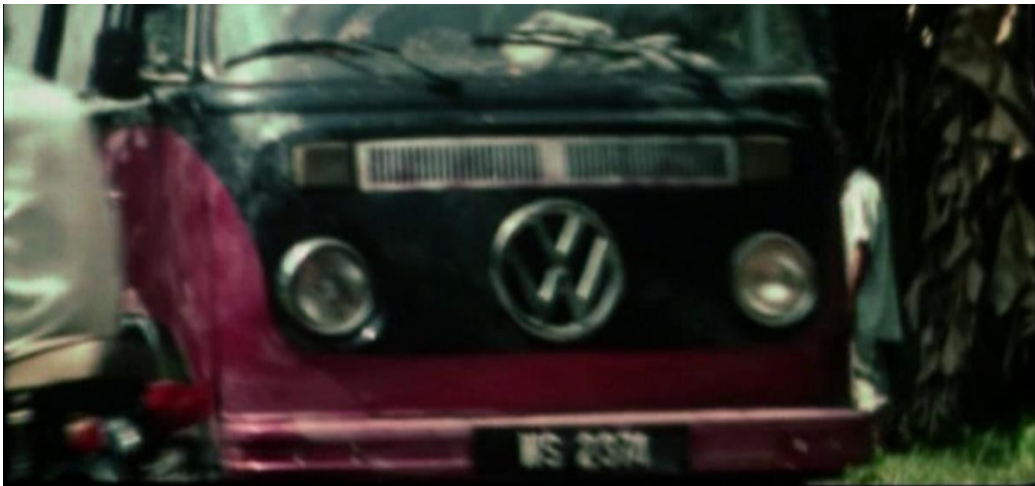
Motor terpaksa ke tepi untuk beri laluan kepada van tersebut