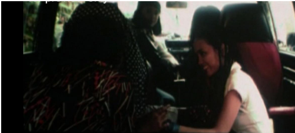
Remaja Hippies dalam van tersebut

Bingkai di bawah pula menunjukkan posisi Zaleha yang sedang menaiki basikal serta sebuah van sedang juga menuju ke arahnya dan diakhiri dengan kemasukan bunyi seakan berlaku pelanggaran. Dari segi semiotiknya, proses perjalanan darah boleh tergugat jika terdapat unsur asing yang masuk ke dalam saluran darah tersebut. Jalan utama menjadi tanda tempat saluran darah yang bertindak sebagai nadi budaya masyarakat kampung, rutin harian sekitar nadi ini dipaparkan seakan terhenti dan tersentak dengan kedatangan virus-virus asing (props semiotiknya van). Pertembungan budaya tersebut mencabar budaya ‘dominan’ bahawa tarian zapin ini sepatutnya berpotensi lebih luar biasa untuk meneruskan kelangsungan fungsi sosial dan budayanya dengan tenang tanpa ada pengaruh asing yang mengancam budaya warisan warisan.