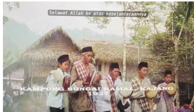
Rajah 7: Paparan kapsyen asal usul Leftenan Adnan

Pemaparan asal usul secara eksplisit dapat diperhatikan menerusi penyampaian dialog dan visual teks lokasi tempat. Penyampaian dialog hanya digunakan dalam filem Mat Salleh Pahlawan Sabah (1983) yang disampaikan oleh sebuah watak fiksyen yang menceritakan tentang asal usul Paduka Mat Salleh dari Sabah. Manakala, visual teks pula digunakan dalam filem Leftenan Adnan (2000), 1957: Hati Malaya (2007) dan Mat Kilau: Kebangkitan Pahlawan (2022) menerusi kapsyen pada layar yang menyatakan nama lokasi seperti “Sungai Ramal” ( Leftenan Adnan ), “Alor Setar, Kedah” ( Tunku Abdul Rahman ) dan “Pulau Tawar, Pahang” ( Mat Kilau ). Gambar 7, Gambar 8 dan Gambar 9 memaparkan kapsyen lokasi yang menandakan asal usul tokoh.