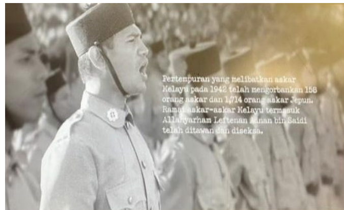
Rajah 2: Pemaparan nama penuh Leftenan Adnan