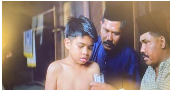
Rajah 11: Pemaparan Adnan semasa kecil dalam filem Leftenan Adnan (2000)

Prinsip ekspansi hanya dilalui oleh dua daripada tujuh tokoh sahaja. Tokoh-tokoh tersebut ialah Leftenan Adnan dan Kanang Anak Langkau. Ekspansi dalam konteks kajian ini melibatkan proses pengembangan dan perluasan terhadap latar masa kehidupan kedua-dua tokoh tersebut. Hal ini dapat diperhatikan apabila kedua-dua tokoh ini diperkenalkan dalam filem semasa usia awal iaitu sama ada sebagai kanak-kanak mahupun remaja. Gambar 11 dan Gambar 12 di bawah memaparkan Adnan dan Kanang semasa usia muda.