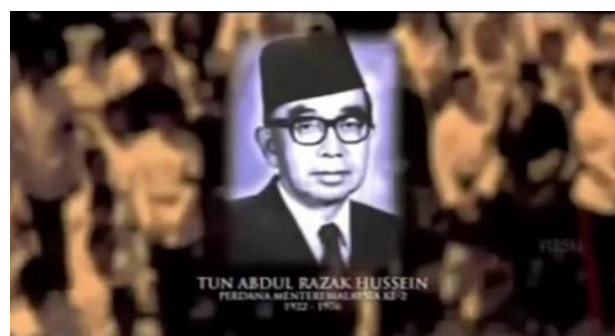
Rajah 4: Pemaparan nama penuh Tun Abdul Razak