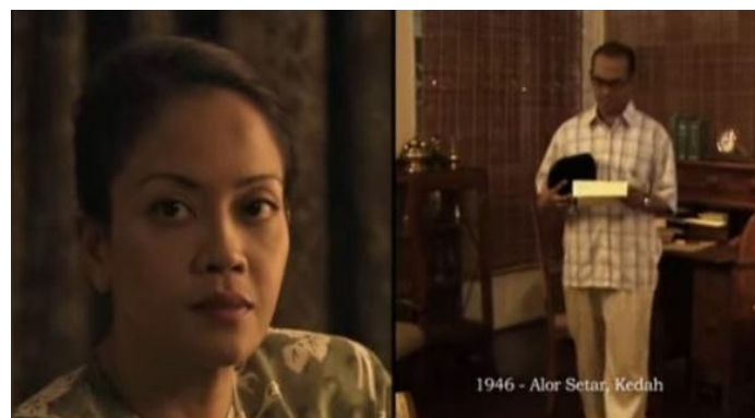
Rajah 8: Paparan kapsyen asal usul Tunku Abdul Rahman Sumber: 1957: Hati Malaya (2007)