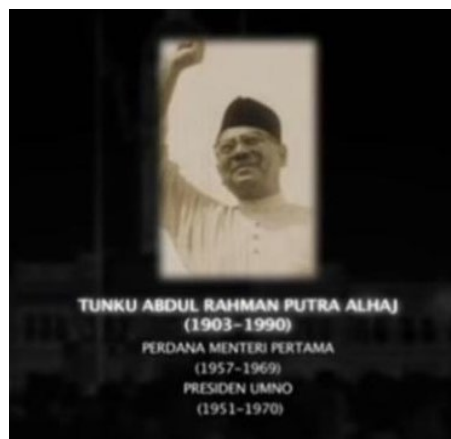
Rajah 3: Pemaparan nama penuh Tunku Abdul Rahman