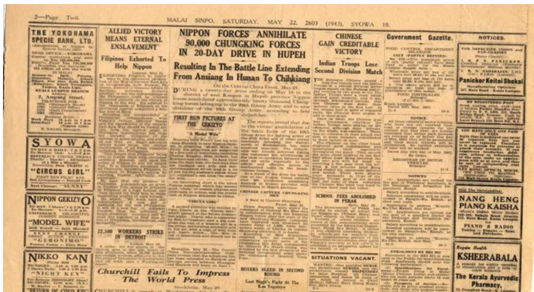
Gambar 1, Bank Jepun yang terdapat di Pulau Pinang