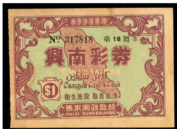
Gambar 3, Loteri Pendudukan Jepun Malaya, $1, Konan Saiken, S/no. 317818