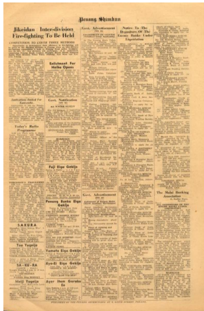
Sumber: Penang Shimibun , 26 April 2602 (1942)