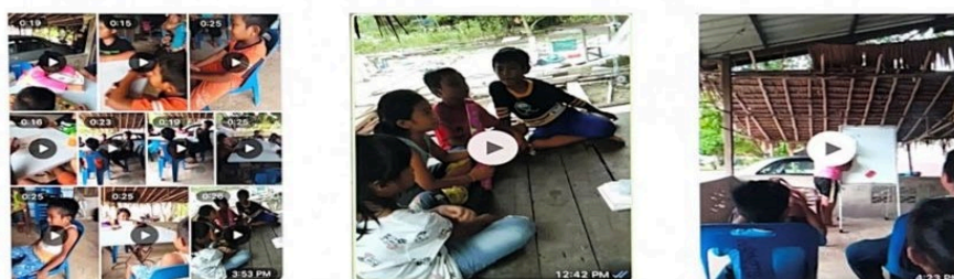
Rajah 3: program Guru Cilik bagi murid Tahun 2 dan Tahun 3 yang diadakan di rumah guru cilik.

Selain itu, guru cilik menggunakan kaedah membaca secara berkongsi ‘pengalaman berkongsi buku’ (Holdaway 1979) dalam Mahzan Arshad (2016). Kaedah ini memberikan peluang kepada murid yang lebih mahir menjadi model kepada murid yang kurang mahir. Murid yang kurang mahir akan cuba mengikut murid yang mahir membaca sehingga dapat menguasai semua kemahiran membaca dalam bahasa Melayu. Guru cilik akan mula membaca perkataan manakala rakan-rakan dalam kumpulan akan membaca mengikut perkataan yang disebut oleh guru cilik. Hasil dapatan menunjukkan cara yang paling sesuai bagi membantu murid OA memahami sesuatu perkataan itu adalah dengan membaca secara lantang bahan tersebut bersama-sama. Cara ini juga dapat membantu menggerakkan pengalaman murid dan membina istilah latar dan konsep yang terdapat dalam bahan bacaan bagi tujuan berseronok atau pelbagai variasi. Kumpulan murid Tahun 2 dan Tahun 3, bukan sahaja diberikan kad imbasan, modul khas Bahasa Melayu untuk kelas pemulihan, tetapi juga diberikan buku cerita yang mengandungi imej berwarna dengan pecahan suku kata. Setelah selesai membaca berulang-ulang kali mereka akan memilih perkataan dan menulisnya di papan putih. Kaedah membaca secara berkongsi dan membaca lantang kerap digunakan oleh murid yang baru belajar asas membaca terutama pada tahap 1 (Tahun 1, 2 dan 3).