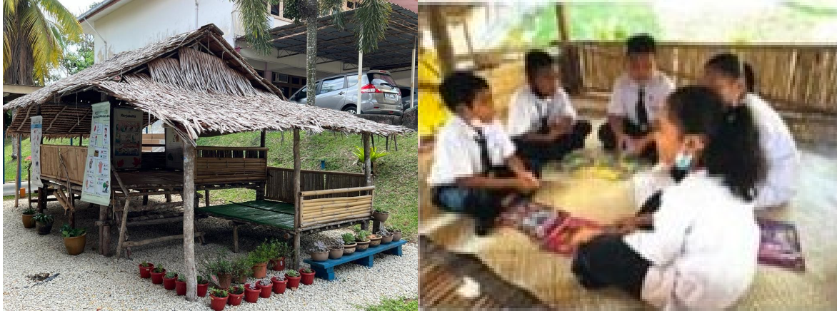
Rajah 4: Murid OA belajar di pondok bacaan yang telah dibina oleh keluarga mereka di dalam kawasan sekolah.

berjaya menguasai kemahiran K6, menggunakan kaedah membatang perkataan, walaupun lambat tetapi guru kelas pemulihan lebih gemar menggunakan kaedah tersebut berbanding dengan kaedah fonik untuk membaca bahasa Melayu. Hasil dapatan kajian juga menunjukkan bahawa pencapaian murid Tahun 2 dan Tahun 3 tiada perbezaan yang ketara disebabkan keduanya baru belajar mengenal huruf, suku kata, perkataan, asas dalam bacaan bahasa Melayu.