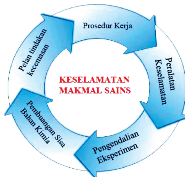
RAJAH 2. Pendekatan 5P

Pendekatan 5P (Rajah2) merupakan lima komponen utama yang mewakili peraturan-peraturan yang terdapat di dalam makmal Sains, iaitu (1) Prosedur kerja; (2) Peralatan keselamatan; (3) Pengendalian eksperimen; (4) Pengurusan sisa bahan kimia dan (5) Pelan tindakan kecemasan. Pendekatan ini digunakan bagi memudahkan guru dan pembantu makmal menyampaikan maklumat dan pelajar pula mudah untuk memahami dan mengingati maklumat yang disampaikan. Apabila pelajar dapat menerima dan mengingati maklumat yang disampaikan, secara tidak langsung amalan baik keselamatan makmal Sains dapat dipraktikkan.