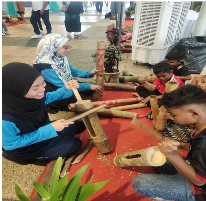
GAMBAR 4. Interaksi Komuniti Setempat Ikut Serta Demonstrasi Permainan Tradisional Masyarakat Orang Asli Suku Semai

Terbaharu menerusi program yang dianjurkan oleh Muzium Seni Kraf Orang Asli dengan kerjasama Jabatan Kemajuan Orang Asli (JAKOA) iaitu Magis Belantara 2024 pada 10 Ogos 2024 sehingga 11 Ogos 2024 yang mempamerkan pelbagai aktiviti menarik termasuklah demonstrasi pembuatan dan aktiviti menyempit, anyaman, ukiran topeng, baju kulit kayu dan sebagainya. Peluang keemasan ini membolehkan komuniti setempat mengenali masyarakat Orang Asli serta mengambil bahagian dalam menyertai aktiviti yang disediakan. Misalnya, bermain alat permainan tradisional suku kaum Semai, mengenali baju kulit mereka serta alat sumpit. Ini membuktikan penglibatan komuniti setempat dan masyarakat Orang Asli khususnya dilihat berjaya kerana pendekatan ini bukan sahaja berkonsepkan ilmu bahkan memupuk kesedaran komuniti terhadap keunikan warisan budaya mereka yang eksotik bernilai tinggi.