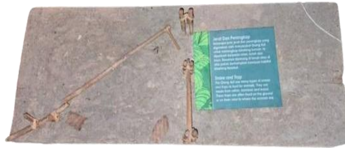
GAMBAR 1. Perangkap Belantik atau Dark