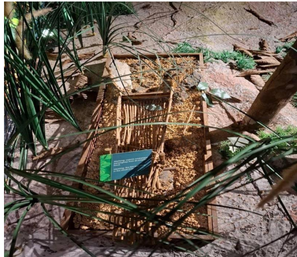
GAMBAR 2. Alat Jerat Meriang atau Marik