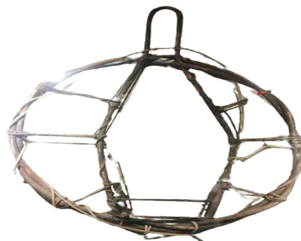
GAMBAR 3. Alat Jerat Tupai atau Bakoq

Jerat tupai atau bakoq dalam sebutan suku Semai merujuk kepada perangkap yang digunakan untuk menangkap haiwan jejangkit seperti tupai dan lutong. Bakoq berfungsi untuk menjerat haiwan tangkapan dan tidak mematikan. Bahan-bahan asas alat jerat ini sepenuhnya menggunakan rotan. Proses pembuatan jerat bakoq ini biasanya merangkumi proses mencari bahan, penyediaan dan pembuatan. Proses ini tidak merbahaya kepada orang sekitar tetapi berisiko kepada si pemasang. Menurut Sali Bah Bola (2024), si pemasang jerat itu harus memanjat pokok untuk mendapatkan tangkapannya. Ini bermaksud, orang yang memasang alat jerat ini berdepan dengan risiko keselamatan kerana perlu memanjat dan berdiri di atas dahan pokok. Kebiasaannya, tangkapan seperti tupai dan lutong dibuat di pokok gempas dan pokok merbau. Terpulang kepada kecekapan individu itu bagaimana dia memasang jerat tersebut dan kaedah menangkapnya. Ini kerana, sedikit kesilapan sahaja boleh menyebabkan si pemburu atau pemasang jerat terjatuh dari atas pokok. Oleh itu, mereka yang pakar lazimnya sudah arif dengan kaedah memasang jerat ini kerana memerlukan teknik bertepatan.