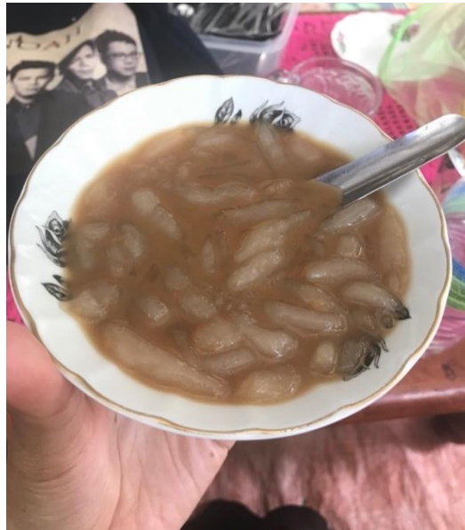
GAMBAR 6. Cendol Sagu Rumbia- campuran cendol yang diperbuat dari tepung sagu rumbia, santan, gula melaka dan air batu.