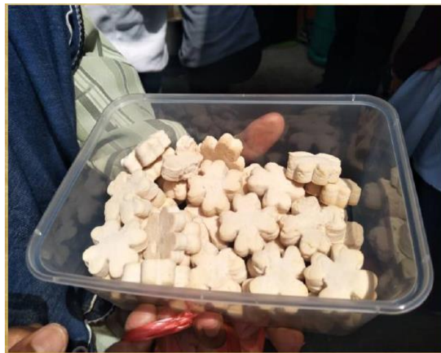
GAMBAR 7. Kuih Bangkit Sagu Rumbia