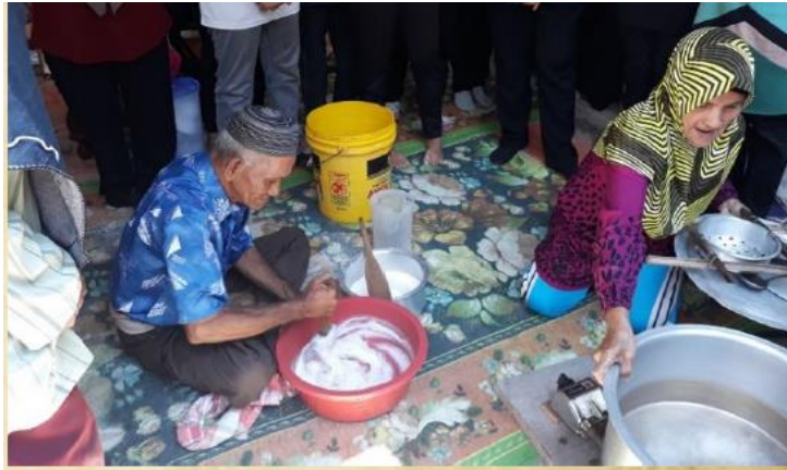
GAMBAR 3. Proses menyiapkan bancuhan tepung Sagu Rumbia bagi membuat cendol Sagu Rumbia