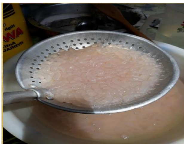
GAMBAR 5. Cendol Sagu Rumbia yang telah siap dimasak