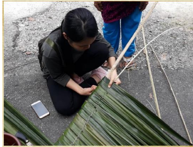
GAMBAR 8. Proses menyemat/ menjahit daun rumbia menggunakan rotan.

Lapangan 2019). Daun ini kemudiannya dijahit pada buluh yang diraut untuk dijadikan tulang atap yang dikenali sebagai Mengkawan atau Bengkawan (Gambar 8 dan Gambar 9). Manakala, kulit kayu bemban atau rotan pula diperlukan untuk menjahit atau menyemat helaian daun rumbia seperti yang ditunjukkan dalam gambar 10.