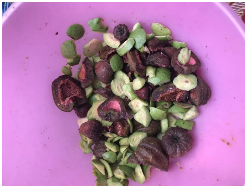
GAMBAR 1. Antara buah-buahan yang digunakan untuk menghasilkan Kebebe.

Hasil pemerhatian juga mendapati, Kebebe perlu melibatkan ramai tenaga kerja kerana proses pembuatannya yang rumit, bermula dari mencari dan menyediakan bahan-bahannya. Lazimnya penduduk kampung menyediakan juadah ini ketika majlis-majlis tertentu seperti kenduri kendara, pelancong yang datang menginap di inap desa, festival warisan dan lain-lain. Tinjauan di lapangan juga mendapati, golongan remaja turut didedahkan dan terlibat sama dalam pembuatan Kebebe. Hal ini bermaksud, komuniti setempat komited dalam mengekalkan makanan warisan ini dengan melibatkan pelbagai peringkat usia.