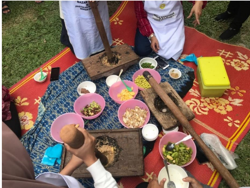
GAMBAR 2. Melumatkan beberapa buah-buahan, cili padi dan belacan menggunakan lesung kayu.