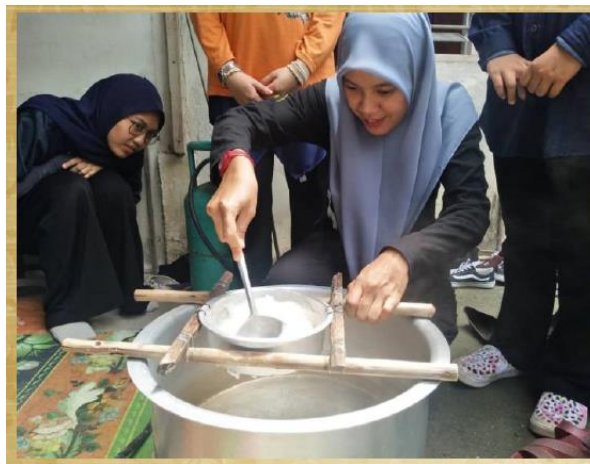
GAMBAR 4. Bancuhan yang telah siap dilenyek pada acuan cendol untuk direbus