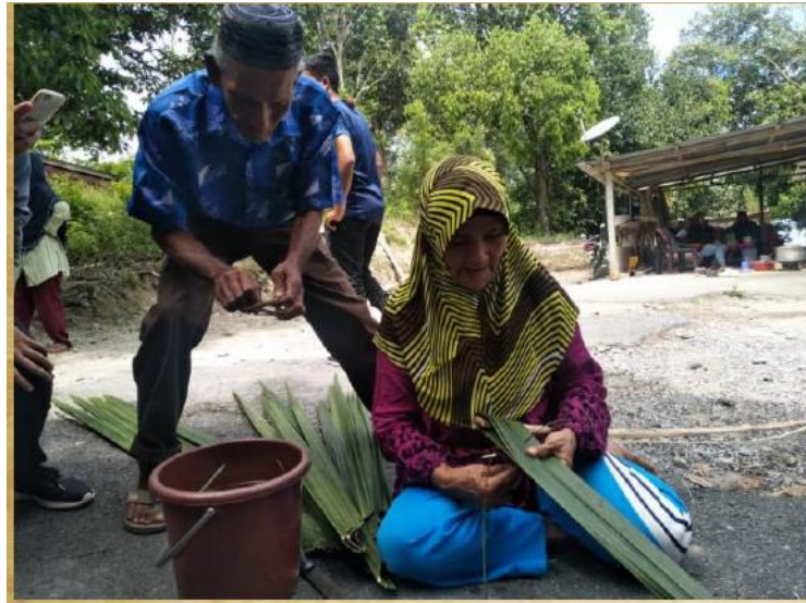
GAMBAR 10. Demonstrasi menjahit/ menyemat daun rumbia bagi menghasilkan atap rumbia.

Hasil tinjauan mendapati, perusahaan atap rumbia masih lagi dilakukan oleh segelintir penduduk kampung secara kecil-kecilan untuk kegunaan sendiri dan jualan berskala kecil. Ada juga beberapa orang penduduk kampung yang mengambil tempahan menghasilkan atap rumbia secara sambilan. Selain itu, penduduk kampung juga masih lagi komited dalam melindungi dan menanam pokok rumbia bagi memastikan mereka mudah mendapatkan bekalan atau bahan mentah. Namun, hasil tinjauan mendapati, tidak ramai golongan muda yang tahu dan berkemahiran dalam menghasilkan atap rumbia di kampung ini. Walau bagaimanapun, golongan muda di kampung ini masih didedahkan dengan pembuatan atap rumbia yang memperlihatkan mereka mempunyai pengetahuan mengenai bahan dan teknik pembuatannya. Faktor modenisasi dan penghijrahan dilihat antara penyumbang yang menyebabkan golongan muda di kampung ini kurang berminat dalam mengusahakan atap rumbia.