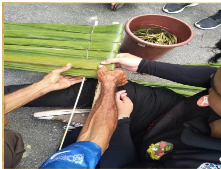
GAMBAR 9. Daun rumbia yang telah direndam selama 2 minggu dijahit menggunakan rotan.