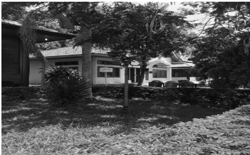
RAJAH 1. Rumah Kajian Hamka berhampiran Tasik Maninjau