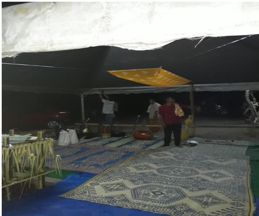
RAJAH 2. Pemasangan kain langit-langit (Pemerhatian penyelidik pada Jumaat 20 April 2018)

tengah balai mengikut kedudukan Tok Mindok iaitu memanjang mengikut arah ‘ senaik jatuh ’. Kain langit-langit adalah berwarna kuning sebagai lambang tanda penghormatan kepada kuasa ghaib dan dengan harapan memujuk kuasa ghaib agar menyembuhkan sakit yang dideritai pesakit. Pada kain langit-langit, digantung keropok ikan berbentuk bulat sebesar tapak tangan yang berwarna warni, batang tebu yang dipotong kecil, tujuh jenis bunga, dan pisang emas. Langit-langit adalah penting bagi menghormati kuasa ghaib yang turun mengubati pesakit yang mempunyai sakit angin. Hal ini kerana, makhluk ghaib yang menjaga, membantu dan mengawasi upacara ini berada di atas langit-langit. Bahan-bahan yang digantung di langit melambangkan taman untuk menarik perhatian makhluk ghaib. Para pesakit duduk melunjurkan kaki di bawah langit-langit dan mengadap kepada panjak semasa ritual dijalankan.