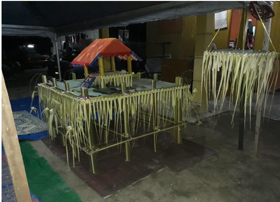
RAJAH 3. Balai dan gantungan (Pemerhatian penyelidik pada Jumaat 20 April 2018)

Berkain pelikat dan memakai t-shirt biasa adalah pakaian ringkas pada malam Main Peteri di Kampung Paloh. Di bahagian pinggang Tok Peteri diikat dengan sehelai kain lepas berwarna putih untuk memperkemaskan ikatan kain pelikat atau dikenali dengan 'ikat bengkung'. Terdapat satu lagi kain lepas berwarna putih yang diselempangkan diatas bahu atau diikat di bahagian perut untuk kegunaan mengelap peluh. Pakaian Tok Mindok dan panjak yang lain adalah pakaian yang dipakai seharian, bergantung kepada pilihan dan keselesaan mereka. Antara alat perjamuan selain perjamuan di atas balai, sangkak ayam, dan gantungan, pihak Tok Peteri pula perlu menyediakan pulut kuning/pulut semangat, ayam panggang, satu sikat pisang emas, dua sikat pisang jelai berangan, pelbagai jenis biskut, bepang, agar-agar, dan dodol. Alat-alat ini disediakan di atas dulang hantaran.