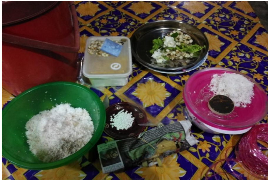
RAJAH 4. Sebahagian alat untuk Talam Guru (Pemerhatian penyelidik pada Jumaat 20 April 2018)

Alat-alat ini disediakan di atas dulang hantaran dan dilakukan oleh Tok Peteri bagi mengelakkan sakit yang menimpa pesakit terkena pada para pengunjung dan ahli keluarga yang lain sekiranya alatan perjamuan tersebut disediakan oleh tuan rumah atau keluarga pesakit. Menurut informan (temu bual dengan Hassan bin Abdullah, 20 April 2018), sekiranya alatan perjamuan yang perlu disediakan Tok Peteri sebaliknya disediakan tuan rumah, kemungkinan untuk sakit terkena kepada jiran dan ahli keluarga yang lain adalah tinggi.