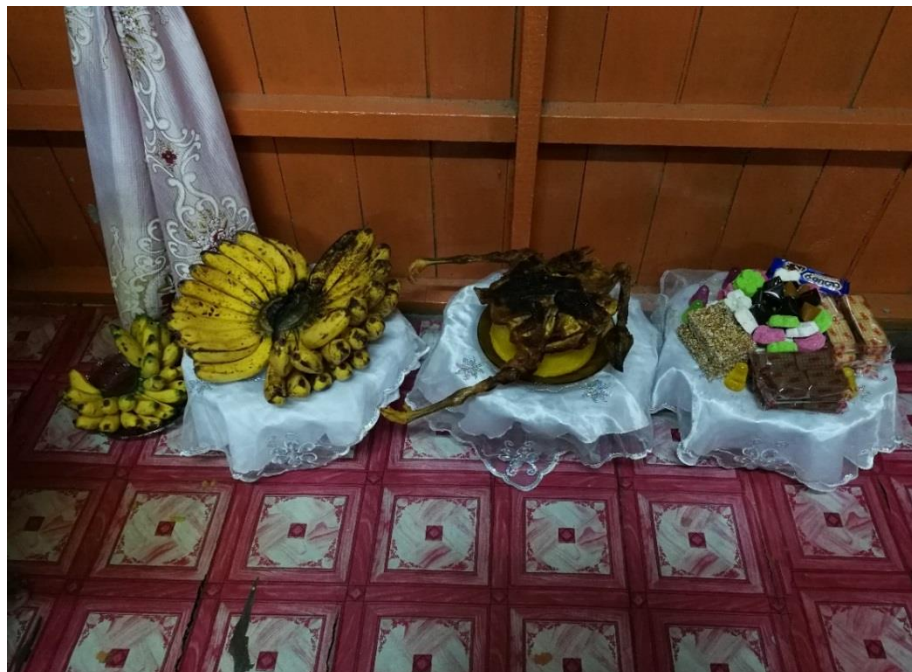
RAJAH 5. Alatan perjamuan yang disediakan Tok Peteri (Pemerhatian penyelidik pada Jumaat 20 April 2018)

Alat-alat ini disediakan di atas dulang hantaran dan dilakukan oleh Tok Peteri bagi mengelakkan sakit yang menimpa pesakit terkena pada para pengunjung dan ahli keluarga yang lain sekiranya alatan perjamuan tersebut disediakan oleh tuan rumah atau keluarga pesakit. Menurut informan (temu bual dengan Hassan bin Abdullah, 20 April 2018), sekiranya alatan perjamuan yang perlu disediakan Tok Peteri sebaliknya disediakan tuan rumah, kemungkinan untuk sakit terkena kepada jiran dan ahli keluarga yang lain adalah tinggi.