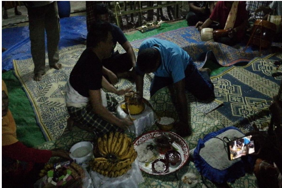
RAJAH 9. Pesakit bertindak seperti harimau apabila angin hala berjaya dipujuk oleh Tok Peteri (Pemerhatian penyelidik pada Jumaat 20 April 2018)