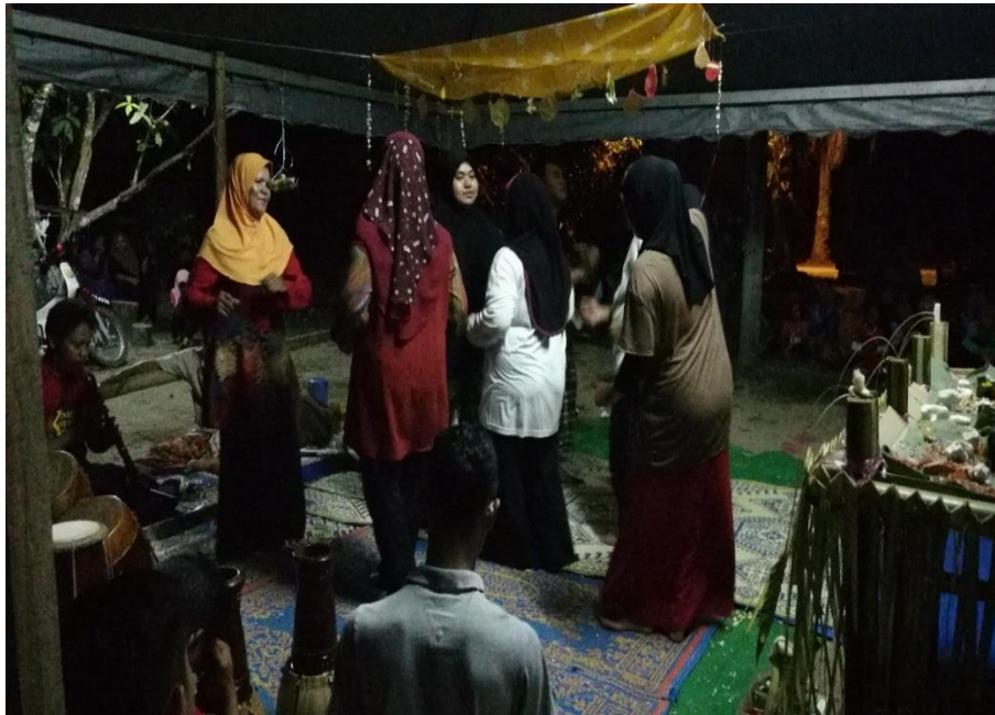
RAJAH 10. Penonton diajak untuk berjoget bersama pesakit (Pemerhatian penyelidik pada Jumaat 20 April 2018)

Upacara menurun dan memadah diadakan semasa bacaan mentera oleh Tok Peteri Muda ketika merawat pesakit. Ketika berada dalam keadaan lupa, Tok Mindok yang berkomunikasi dengan makhluk ghaib melalui badan Tok Peteri Muda menyebutkan mengenai jamuan yang disediakan untuk makhluk ghaib agar menjauhi pesakit. Hal ini penting bagi memujuk makhluk ghaib atau saka yang ada dalam keluarga pesakit ini untuk keluar dan tidak mengganggu pesakit lagi. Tok Peteri Muda dalam keadaan tidak sedar berjalan ke balai, menolak-nolak, sambil memegang balai dan menggelengkan kepala perlahan-lahan dan semakin kuat. Selain itu, Tok Peteri Muda juga memegang sangkak dan gantungan untuk melihat perjamuan yang disediakan. Perkara ini penting untuk memastikan makhluk ghaib saka ini berpuas hati dengan perjamuan yang disediakan dan tidak meminta keperluan lain pada masa datang. Tok Peteri Muda memaklumkan kepada makhluk ghaib saka ini bahawa perjamuan ini diletakkan di suatu tempat untuk makhluk ghaib tersebut menjamu.