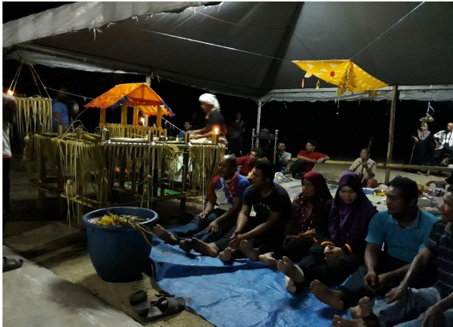
RAJAH 11. Pesakit dalam upacara mandi limau (Pemerhatian penyelidik pada Jumaat 20 April 2018)