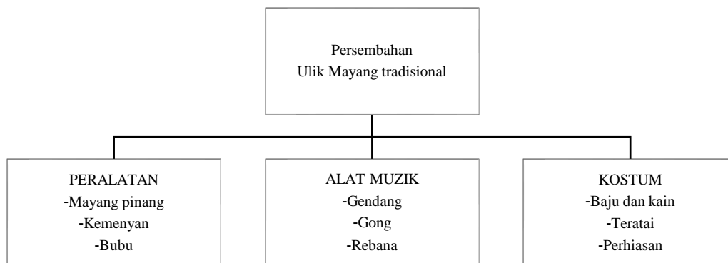
RAJAH 1. Peralatan, Alat Muzik dan Kostum Persembahan Ulik Mayang

Rajah 1 di atas adalah antara kelengkapan yang digunakan dalam persembahan Ulik Mayang tradisional. Segala keperluan ini adalah menjadi elemen utama dalam struktur persembahan Ulik Mayang tradisional yang banyak berunsurkan ritual. Walau bagaimanapun, penggunaan semua kelengkapan dia atas telah banyak ditransformasikan penggunaannya dalam persembahan Ulik Mayang masa kini.