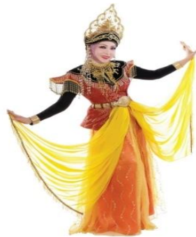
RAJAH 3. Kostum Pakaian Penari Ulik Mayang

Dari sudut penggunaan baju dan kain para penari dalam persembahan Ulik Mayang, ia adalah tidak bersifat tetap. Pemilihan dan penggunaan dari sudut warnanya adalah bergantung pada koleksi sedia ada penganjur itu sendiri sama ada menggunakan baju dan kain yang bewarna kuning, merah, hijau atau lain-lain. Walau bagaimanapun, penggunaan selendang, teratai, serta barangan perhiasan lain semestinya turut digunakan bagi memperlihatkan visual seorang puteri dalam diri setiap para penari yang terlibat. Kelengkapan aksesori yang digunakan juga adalah tidak begitu spesifik namun hanya dijadikan sebagai perhiasan sahaja di bahagian-bahagian tubuh yang penting bagi menunjukkan persamaannya dengan gambaran visual seorang puteri yang rupawan dan berhias. Lihat Rajah 3.