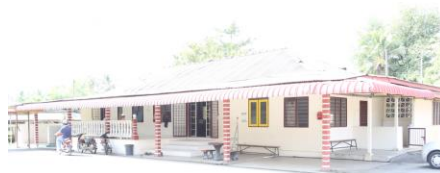
RAJAH 4: Surau Haji Abbas