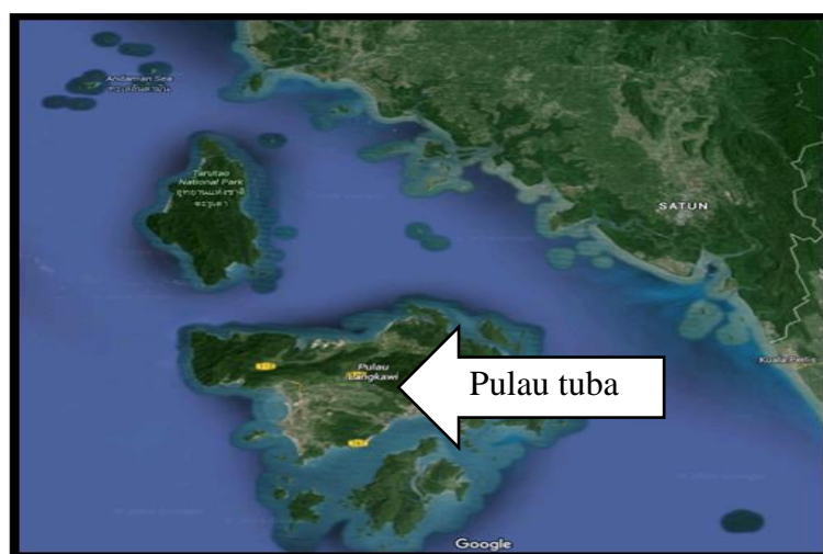
PETA 1 : Kedudukan Pulau Tuba dan Satun

Jadual 2 menunjukkan nama-nama kampung yang dikaji. Antara rasional kedua-dua kawasan ini dipilih adalah kerana menurut Ahmad Omar Chapakia (2003), Satun merupakan salah satu negeri yang berasal daripada sebahagian negeri Kedah. Hal ini secara tidak langsung dapat dijelaskan bahawa, DMK terutamanya Langkawi mempunyai pengaruh dialek yang sama akibat daripada perjanjian Siam-British di Bangkok yang berlaku pada tahun 1909. Peta 1 menunjukkan kedudukan Pulau Tuba, yang bersebelahan dengan Satun.