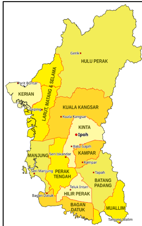
RAJAH 2. Peta Negeri Perak yang menunjukkan Jajahan Perak yang mempunyai sebagai Orang Besar Jajahan