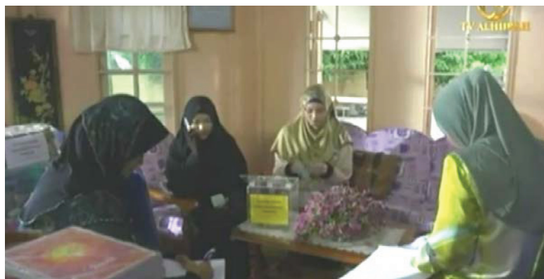
GAMBAR 7 Antara busana yang dipakai oleh pelakon wanita (ep.7)

Pemilihan busana watak wanita dan lelaki dalam drama ini, mempunyai tujuan tertentu terutama apabila berlakunya perubahan misalnya babak Amir yang berjubah di rumah tetapi akan memakai kemeja dan kot ketika di pejabat (Yu Chee Boon 2014). Pemilihan Busana bagi watak wanita semuanya dikawal agar menutup aurat termasuklah pelakon tambahan.