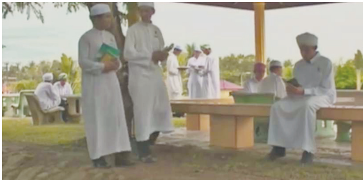
GAMBAR 3 Busana yang dipakai oleh pelajar lelaki (ep. 4)

Bagi pakaian watak wanita, gambar 4 menunjukkan suasana pelajar ketika di sekolah memakai baju kurung sekolah dan tudung labuh sebagaimana dalam episod 2 hingga 6. Ketika watak Wardah dan Tasnim melanjutkan pelajaran di Universiti