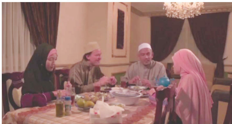
GAMBAR 1 Busana yang dipakai oleh pelakon wanita dan lelaki

Berdasarkan Gambar 1 dan 2, watak utama yang dilakonkan oleh pelakon wanita dilihat memelihara aurat mereka mengikut kepada syariat Islam dengan memakai pakaian seperti baju kurung, jubah, atau kemeja lengan panjang dan labuh serta tudung sama ada di dalam rumah atau di luar rumah. Bagi watak sampingan seperti pelajar Mesir, wanitanya dilihat memakai tudung labuh dan purdah seperti babak mereka turun dari bas. Pelakon utama wanita juga dilihat memakai sarung tangan untuk memelihara aurat tangan mereka dari terdedah. Solekan untuk watak wanita juga dilihat tidak keterlaluan dan berlebih-lebihan.