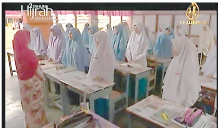
GAMBAR 4 Busana yang dipakai oleh pelajar wanita (ep. 4)