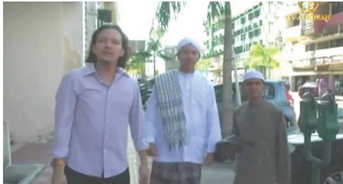
GAMBAR 6 Antara busana yang dipakai oleh pelakon lelaki (ep. 4)

serban selepas episod ke 8, walaupun ke tempat kerja seperti Mior menunjukkan penghijrahan yang berlaku dalam diri Bakar. Gambar 6 menunjukkan tiga jenis pakaian lelaki yang sesuai dengan watak dan tuntutan Islam iaitu pakaian kasual, baju Raihan berkain pelekat serta baju Melayu.