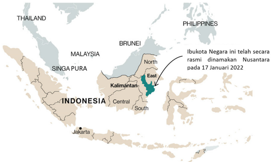
Peta 1: Ibu Kota Nusantara (IKN) di Kalimantan Timur

Sebaliknya, Kerajaan Malaysia melihat isu ini dari sudut yang berbeza. Pemindahan ibu kota Indonesia dari Jakarta ke Nusantara (IKN) di Kalimantan Timur dilihat akan memberi kesan terhadap keselamatan negara kerana kedua-dua negara berkongsi sempadan darat yang panjang. 29 Pembangunan ini tentunya bukan sesuatu yang dianggap positif atau menguntungkan bagi Malaysia. Salah satu kebimbangan utama ialah kemungkinan peningkatan arus migrasi penduduk dari Indonesia ke sempadan Malaysia pada masa akan datang. Situasi ini belum mengambil kira tahap kesediaan untuk menghadapi pelbagai isu yang berpotensi timbul, terutamanya dalam aspek kawalan sempadan yang memerlukan pengawasan yang lebih ketat dan berkesan. 30 Bahagian berikutnya akan menganalisis kepentingan strategik perpindahan ibu kota dari Jakarta ke IKN di Kalimantan Timur bagi Kerajaan Indonesia.