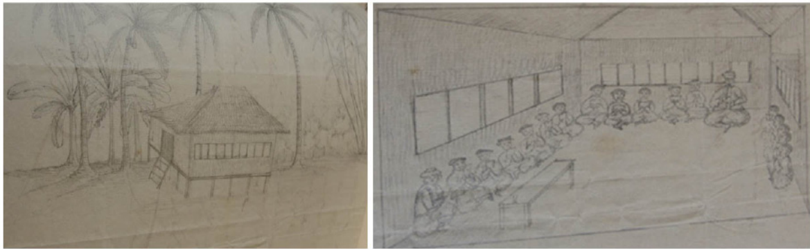
Gambar 1: Gambaran luaran dan dalaman sekolah Melayu di Kedah yang diselia oleh A. D. Maingy Esqr. dan dipercayai telah dilukis oleh Buruly.