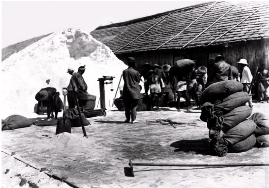
Rajah 1.2 Tempat Penghasilan Garam Semasa Penaklukan Jepun Di Taiwan 27

situ untuk memproses penghasilan garam dan menanam tebu.