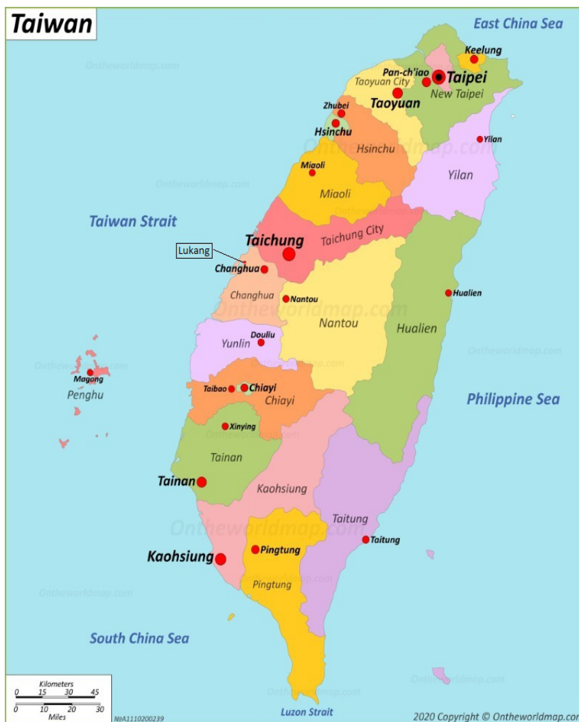
Peta 1.1 Peta Kawasan Lugang di Taiwan

Lugang di Taiwan. Garam di Taiwan mula dieksport ke luar negara dan tidak hanya dijual dalam negara. Eksport garam ke Jepun 24 secara besar-besaran telah membawa keuntungan yang lumayan kepada Koo Hsien Jung.