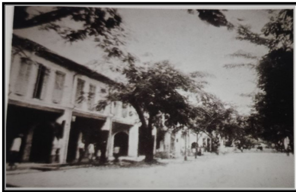
RAJAH 2. Keadaan bandar Lukut pada abad ke-19

pengangkutan dan perdagangan (L.D. Gammans 1924). Pelabuhan Sungai Lukut dapat menampung kehadiran sejumlah kapal besar yang dimiliki pemodal Negeri-negeri Selat dan juga pedagang Barat. Pelabuhan Sungai Lukut dilengkapi pelbagai kemudahan infrastruktur serta gudang yang besar sehingga memberi keselesaan untuk pedagang singgah berdagang. Keadaan ini menjadikan Lukut dikenali sebagai “ straits produce ”. Lukut turut menjadi tumpuan dan laluan utama pemodal Negeri-negeri Selat, pedagang dan imigran Cina dari Negeri-negeri Selat. Di samping itu pedagang juga boleh berlindung daripada tiupan angin Monsun Timur Laut dan Barat Daya sebelum meneruskan perjalanan bagi menjalankan kegiatan perdagangan.