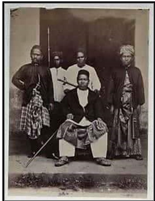
RAJAH 3. Raja Bot diapit adinda-adindanya ketika menjadi Raja Lukut

dan pemerintahan Raja Bot, keamanan dan sosioekonomi Lukut sangat kukuh dan stabil. Perkembangan ini dapat dilihat apabila kebanyakan lombong bijih timah di Lukut sangat produktif dalam mengeluarkan hasilnya. Malah, kadar cukai sebanyak sepuluh peratus terhadap hasil bijih timah yang dieksport juga masih dikekalkan. Keadaan ini turut menyebabkan pedagang dari Selangor berminat untuk menjalankan perniagaan di Lukut.