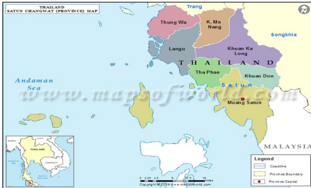
RAJAH 1. Daerah di bawah pentadbiran wilayah Satun

Kawasan pentadbiran wilayah Satun dibahagikan kepada 6 daerah dan 1 subdaerah iaitu daerah Mueang Satun, daerah Tha Phae, daerah Khuan Don, daerah Langu, daerah Thungwa, daerah Khuan Kalong dan subdaerah Manang (Jabatan Pentadbiran Wilayah Satun 2015) ( www.satunpao.go.th ).