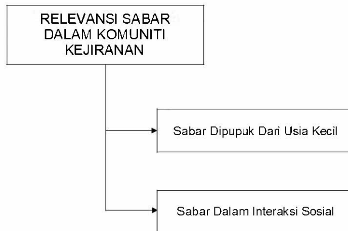
RAJAH 2. Pendekatan Sabar Dalam Komuniti Kejiranan