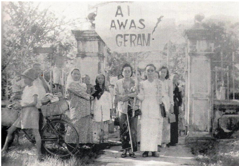
GAMBAR 3 Perhimpunan AWAS yang disertai oleh kaum wanita

"Kalau kamu orang lelaki tidak mahu ikut serta menentang Malayan Union, biar kami srikandi sahaja yang pergi. Kamu orang lebih baik pakai sarung di rumah"