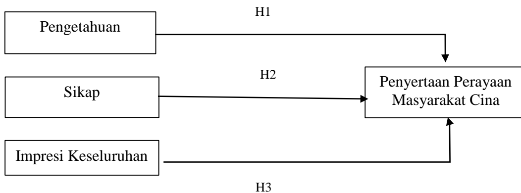
Rajah 1. Rangka kerja konseptual

Berdasarkan perbincangan dalam sorotan Pustaka dan sejajar dengan tujuan serta persoalan kajian, Rajah 1 menunjukkan rangka kerja konseptual telah dibangunkan bagi menggambarkan hubungan antara pengetahuan, sikap dan impresi keseluruhan dengan penyertaan masyarakat Melayu dan Bumiputera dalam perayaan masyarakat Cina.