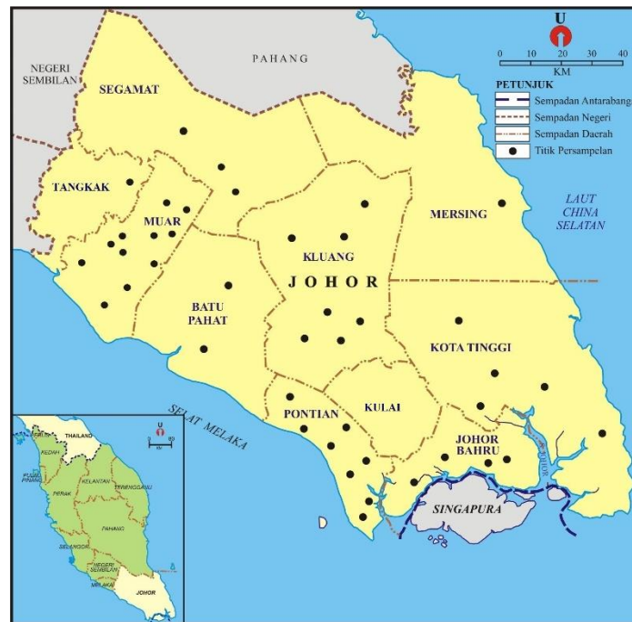
Rajah 1. Taburan agropreneur di Johor

Rajah 1 menunjukkan peta taburan agropreneur yang terlibat dalam industri cendawan di Johor. Taburan letakan perusahaan cendawan dilihat lebih berpusat di Daerah Muar, Kluang dan Pontian. Walau bagaimanapun, faktor lokasi dan pembangunan industri cendawan tidak dipengaruhi oleh persekitaran fizikal dan manusia.