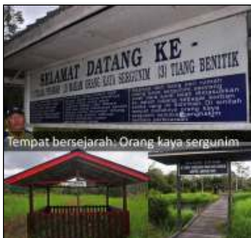
Rajah 4. Sekitar Makam orang kaya Segunim