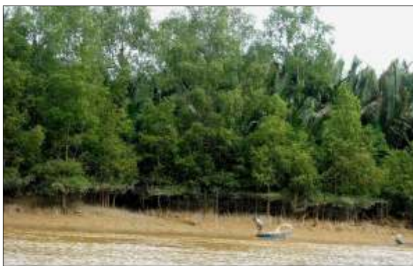
Rajah 7. Persekitaran bakau dan aktiviti menangkap udang oleh komuniti lokal

mengatakan bahawa sistem pengangkutan air berpotensi untuk dimajukan sebagai produk pelancongan. Hal ini berkait rapat dengan potensi sungai Rajang sebagai kawasan pelancongan iaitu sebanyak 8.35 peratus bersetuju dengan pendapat ini. Salah satu sistem pengangkutan di Matu-Daro adalah dengan menggunakan sistem pengangkutan air iaitu bot melalui menyusuri sungai Rajang (Rajah 8). Para pelancong dapat merasai pengalaman menaiki bot dari Sibu ke Daro selama hampir dua jam setengah dengan menikmati pelbagai pandangan alam seperti pokok bakau, buaya, aktiviti penangkapan ikan dan udang serta persekitaran alam semulajadi sepanjang perjalanan tersebut.