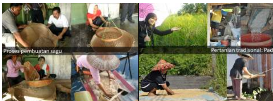
Rajah 5. Proses penghasilan sagu secara tradisional

Penanaman padi secara tradisional juga merupakan potensi agro-pelancongan di kawasan ini (Rajah 6). Sebanyak 8.01 peratus responden berpendapat para pelancong dapat melihat proses penanaman padi yang masih dijalankan secara tradisional di kawasan ini. Kebanyakan kawasan di Malaysia pada masa kini menjalankan penanaman padi secara moden dan komersil. Maka, secara tidak langsung, pelancong tidak kira dalam dan luar negara dapat menghayati nilai estetika yang masih wujud di Matu-Daro.