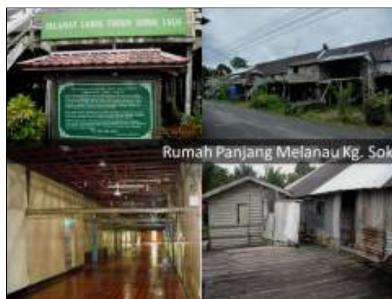
Rajah 3. Rumah Panjang Melanau yang tertua

Daerah Matu-Daro berpotensi untuk dibangunkan menerusi industri pelancongan warisan dan kebudayaan iaitu mencatatkan sebanyak 54.61 peratus. Sebanyak 12.83 peratus responden bersetuju bahawa Rumah Panjang Melanau Islam mempunyai potensi sebagai kawasan pelancongan. Rumah panjang Melanau Islam ini merupakan rumah panjang yang tertua dan satu-satunya di dunia yang masih wujud. Warisan yang unggul ini perlu dipelihara kerana telah berusia 140 tahun dan merupakan satu-satunya rumah panjang bagi etnik Melanau (Rajah 3). Ianya boleh dijadikan tarikan bukan sahaja di peringkat negeri malahan boleh dipromosikan bagi tarikan pelancongan luar negara.