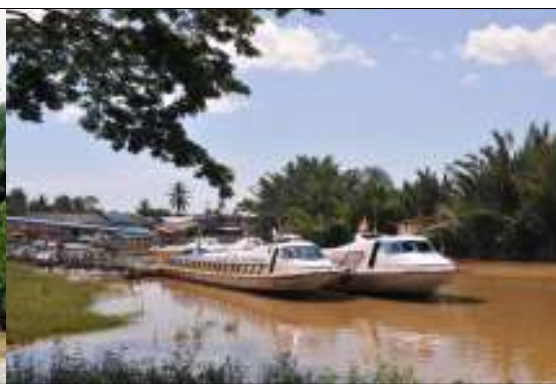
Rajah 8. Pengangkutan menggunakan bot ekspres menyusuri sungai Rajang