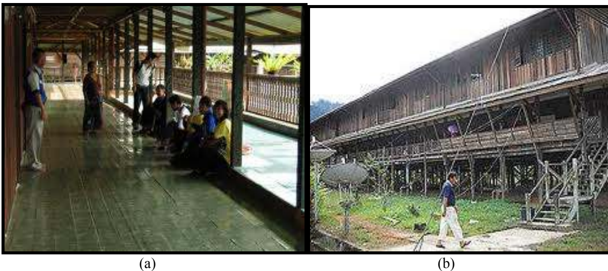
Rajah 3. Kawasan penempatan semula (a) Sungai Koyan Fasa 1 dan (b) Sungai Asap Fasa 1

aktor sosial dalam usaha untuk menemui persepsi mereka tentang pandangan dunia dan alasan yang mengiringi persepsi tersebut. Realiti pemahaman mereka tentang pandangan dunia, cara bagaimana mereka mengkonstruksikan realiti dunia dan kehidupan dan penginterpretasian mereka adalah tertanam dalam bahasa harian aktor sosial iaitu bahasa komuniti Penan itu sendiri. Tanggungjawab utama penyelidik kemudiannya untuk memerihalkan semula pemahaman mereka tentang pandangan dunia dalam bahasa teknikal iaitu melalui perbincangan secara saintifik. Dalam masa yang sama, aktor sosial akan bersama-sama dengan penyelidik untuk merundingkan makna tentang sesuatu tindakan dan interaksi terhadap dunia dan kehidupan mereka. Hal ini kerana idea asas tentang abduktif merujuk kepada proses yang digunakan untuk menghasilkan penceritaan saintifik sosial daripada penceritaan aktor sosial dengan menggunakan bahasa, makna, interpretasi, motif dan niat yang digunakan oleh aktor sosial untuk memandu tingkah laku serta kehidupan harian mereka. Justeru itu, kajian ini akan menggunakan pendekatan fenomenologi menggunakan logik abduktif berasaskan ontologi idealis dan epistemologi konstruksionis.