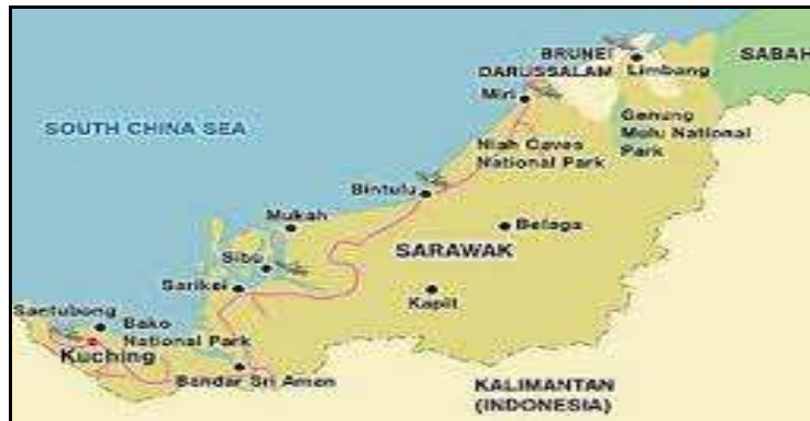
Rajah 1. Lokasi Daerah Belaga, Sarawak

yang dikenali sebagai Daerah Kecil Asap pada 30 Disember 1999 (Pejabat Daerah Belaga, 2011). (sila lihat Rajah 1 dan 2).