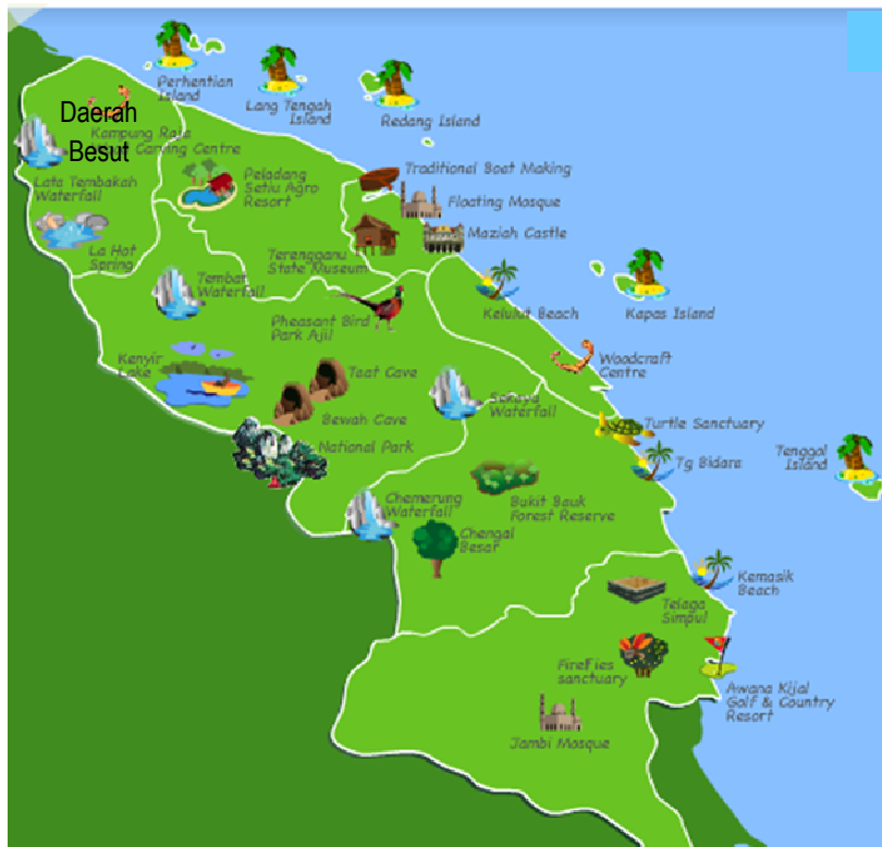
Sumber: Tourism Terengganu, 2011

Sebelum tahun 1990-an, daerah Besut telah mengalami penurunan kedatangan pelancong berbanding pantai peranginan lain di sekitar Kemaman dan Dungun. Pelancong yang datang lebih kepada pelancong harian atau hujung minggu sahaja. Tetapi menjelang tahun 2012, proses pembangunan yang rancak di daerah Besut semenjak tahun 1990-an telah menghidupkan semula sektor pelancongan di destinasi kajian ini dan menjadi lebih popular sebagai pantai peranginan percutian keluarga. Era pembangunan pelancongan semenjak tahun 1990-an tersebut telah memberikan wajah baru kepada kawasan peranginan pantai di daerah Besut. Ini termasuklah pembangunan pelbagai produk pelancongan yang unik dan menarik; pembinaan pelbagai kemudahan penginapan (hotel dan chalet) seperti Bukit Keluang Beach Resort; menaik taraf kawasan rehat dan riadah serta pelbagai kemudahan infrastruktur yang lain seperti ditunjukkan dalam Peta Pelancongan Negeri Terengganu (Rajah 1.2). Aspek kemudahsampaian ke kawasan peranginan di daerah Besut juga menjadi elemen penting dalam memastikan destinasi pelancongan ini terus menerima kedatangan pelancong. Di samping itu, jaringan pengangkutan dan kemudahan pengangkutan awam yang pelbagai serta mudah didapati oleh pelancong turut memastikan setiap destinasi pelancongan ini senang dikunjungi.