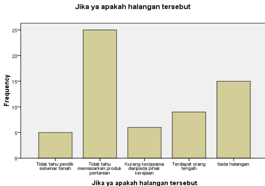
Rajah 2. Halangan terhadap dalam usaha mengerakkan aktiviti pertanian