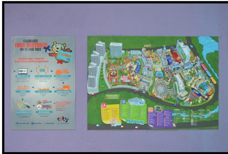
Foto 1. Papan tanda dan peta lokasi kawasan taman tema