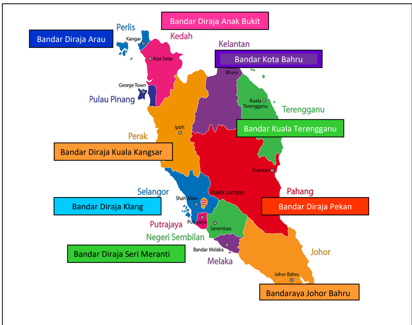
Rajah 2. Bandar Diraja seluruh Malaysia Sumber: Kajian lapangan (2023)