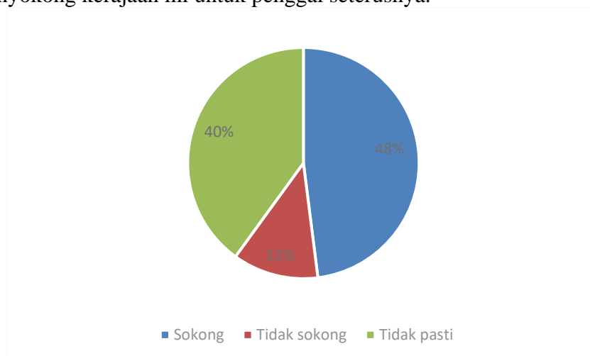
Rajah 2. Sokongan terhadap slogan ‘Madani’ membawa kepada sokongan kepada PMX

Responden masih merasakan corak pemerintahan beliau masih belum jelas. Pemerintahan yang dikatakan hanya setahun jagung masih belum boleh dinilai oleh rakyat. Perubahan dalam negara diakui memerlukan tempoh masa tertentu namun begitu pemimpin perlu memainkan peranan dengan segera supaya rakyat akan terus menyokong kerajaan ini untuk penggal seterusnya.