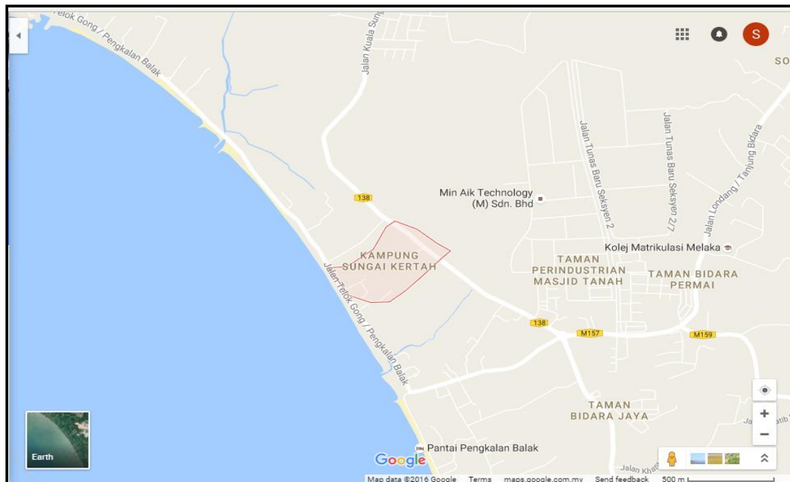
Petunjuk Kampung Sungai Kertah

Dalam kajian ini, pengkaji hanya mendapatkan data di kampung Sungai Kertah sahaja. Kampung Sungai Kertah telah wujud hampir lebih 80 tahun lamanya. Menurut penduduk kampung, kewujudan nama kampung ini muncul daripada beberapa pandangan antaranya terdapat banyak pokok getah yang dibawa masuk oleh pedagang dari luar dan pendapat lain mengatakan bahawa nama kampung Sungai Kertah ini berasal daripada bunyi 'ketam' kerana terdapat banyak ketam yang ditemui di pantai berhampiran dengan laut di Pengkalan Balak. Penduduk di kampung Sungai Kertah ini juga dikatakan cuma seramai 100 lebih orang sahaja yang tinggal kerana telah ramai yang telah berhijrah ke luar kawasan. Malahan, penduduk di Kampung Sungai Kertah ini kebanyakannya terdiri daripada golongan berumur iaitu generasi yang memang asalnya dilahirkan dan dibesarkan di kampung tersebut.