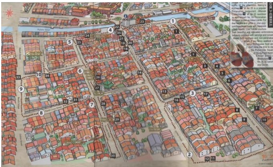
Rajah 1. Peta Persiarian Jonker

Negeri Melaka terletak di pantai barat daya Semenanjung Malaysia, serta bertentangan dengan Sumatera. Keluasan negeri Melaka ialah 166,300 hektar dan ia bersempadankan Negeri Sembilan di utara dan Johor di timur (Unit Perancangan Ekonomi Negeri, Jabatan Ketua Menteri Melaka 2014). Jumlah penduduk Melaka pada tahun 2013 ialah 852,400 orang. Tarikan pelancong yang paling terkenal adalah Jonker Street atau Persiarian Jonker, yang telah dibuka sejak tahun 2000. Persiarian Jonker merupakan jalan utama Chinatown negeri Melaka. Di kawasan Persiarian Jonker terdapat beberapa jalan dan lorong-lorong. Rajah 1 telah menunjukkan kedudukan kedai-kedai di Persiarian Jonker.