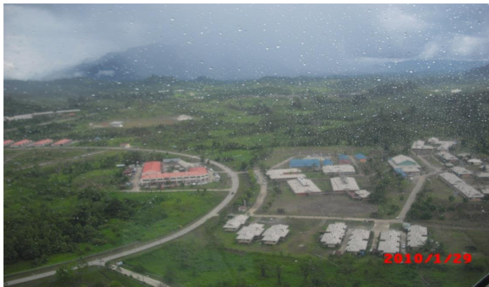
Rajah 2 Kawasan Pekan Sg Asap

Faktor utama yang menyebabkan tiada kemudahan asas ini adalah kerana kos pembinaan yang terlalu mahal serta bilangan komuniti yang sedikit menyukarkan pihak kerajaan memperuntukkan perbelanjaan mengurus kemudahan asas tersebut.