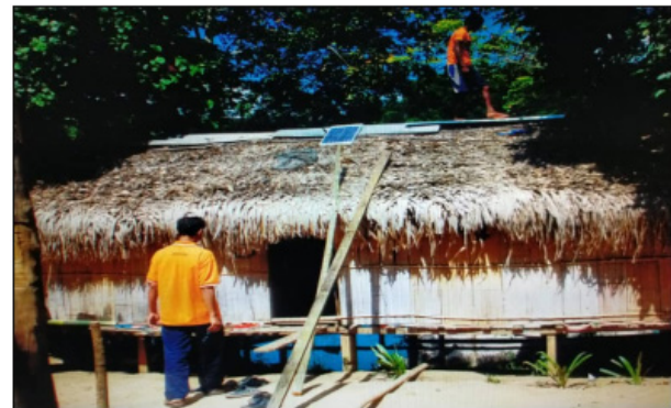
FOTO 3. Rumah penginapan homestay yang telah siap dibina oleh kumpulan belia Orang Asli Kampung Chueh II

berdikari dalam sektor pelancongan sekaligus dapat meningkatkan tahap ekonomi serta memelihara warisan kebudayaan. Malah, pihak JAKOA melalui Geran Bantuan Bimbingan Usahawan Orang Asli turut menyediakan program dan latihan khusus kepada masyarakat Orang Asli terutamanya kepada kelompok belia dengan mengikuti kursus dan latihan secara langsung di bawah bimbingan JAKOA seperti kursus asas pengurusan homestay, kursus pemasaran atas talian, kursus SKM 2, kursus kemas produk dan kursus anyaman rotan (Jabatan Kemajuan Orang Asli 2022).