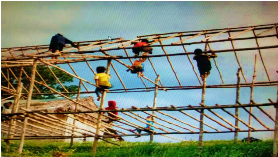
FOTO 1. Kelompok belia Orang Asli Kampung Chueh II bergotong-royong membina rumah penginapan homestay sepanjang tempoh PKP dikuatkuasakan seluruh negara.