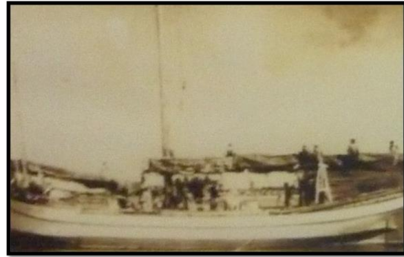
RAJAH 5. Perahu Pinis Gobel