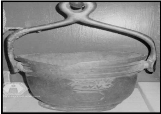
RAJAH 3. Timba Tembaga Masjid Sumber: Ihsan daripada Muzium Kuala Terengganu, 26 Mac 2013