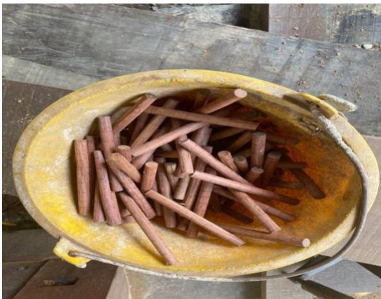
RAJAH 4. Pasak yang Dicipta oleh Tukang Timbal Perahu daripada Kayu Cengal di Terengganu bagi Menggantikan Paku

Apa yang paling unik dilihat dalam kegiatan perusahaan perahu di Terengganu pada ketika itu ialah dilihat dari segi teknik penghasilan sebuah perahu oleh tukang timbal. Hal ini kerana, seorang tukang timbal tidak memerlukan pelan untuk menghasilkan sebuah perahu dan menggunakan imaginasi bagaimana bentuk perahu, panjang dan lebar ketika itu untuk menjadikan sebuah perahu tersebut terapung di permukaan air (SP 6/39: Abdullah Muda, 2002). Ada ketikanya inovasi yang dilakukan bermula secara suka-suka untuk kepuasan diri sendiri atau kemudahan diri sendiri yang kemudiannya tanpa disangka berubah menjadi daya inovasi yang mampu membawa keuntungan kepada pengusaha tempatan (Majalah Dewan Ekonomi, Jun 2012). Malah, teknik pasak, menimbal dan penggunaan kayu cengal yang berkualiti juga merupakan antara teknik yang cukup unik dilihat dari segi penghasilan perahu di Terengganu. Penghasilan perahu inilah kemudiannya digunakan oleh masyarakat tempatan untuk menjalankan kegiatan perdagangan.