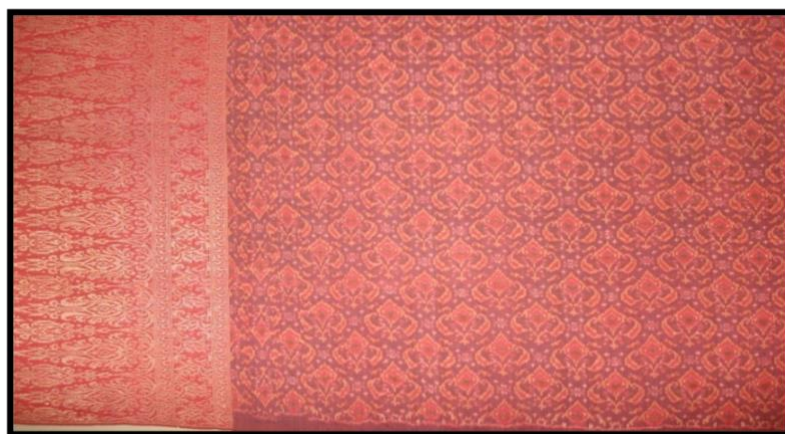
RAJAH 2. Kain Limar Bersongket Emas

Walaupun kadang kala penggunaan kaedah pewarnaan secara tradisional dianggap tidak produktif, namun bagi mengekalkan legasi serta kualiti secara turun temurun, kaedah tersebut dilihat amat menguntungkan negeri. Hal ini kerana, kebanyakan para pedagang luar berminat untuk mendapatkan produk yang diperbuat daripada bahan-bahan asli kerana dianggap lebih tahan lama serta bermutu tinggi. Ketika ini, kebanyakan pengusaha tekstil terdiri daripada kaum lelaki manakala kaum wanita lebih cenderung ke arah teknik-teknik penjualan sahaja. Situasi ini berlaku kerana pada ketika itu perkembangan ekonomi banyak dikaitkan dengan sikap “kerjasama” yang wujud dalam kalangan masyarakat Melayu terutamanya bagi pengusaha yang tinggal di kawasan-kawasan pedalaman. Tindakan yang dilakukan oleh baginda inilah ternyata membawa kesan yang cukup mendalam terhadap industri tekstil di Terengganu pada abad ke-19 (Hugh Clifford 1992).