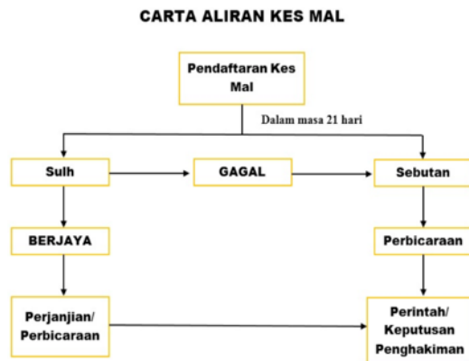
RAJAH 1. Proses Tuntutan kes Mal di Mahkamah Syariah

F., & Pauzai, N. A. 2017). Berikut merupakan proses tuntutannya seperti berikut: