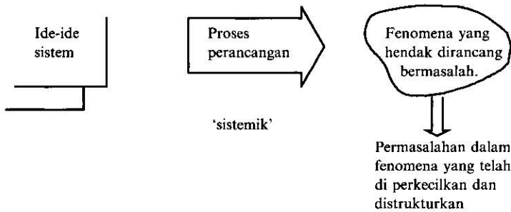
RAJAH 3. Implikasi penggunaan paradigma sistem lembut dalam perancangan.

tetapi hanya sebagai alat yang mungkin berguna untuk memahami sesuatu permasalahan dalam fenomena. Model itu biarlah mudah asalkan dapat membantu menganalisis persoalan-persoalan yang hendak dijawab (Hoos 1972; Checkland and Scholes 1990). Seterusnya model itu digunakan dalam perbincangan dengan mereka yang terlibat untuk mencari penyelesaian sesuatu masalah. Perbincangan-perbincangan itu akan dapat mengambilkira pelbagai faktor seperti faktor politik, sosial dan lain-lain yang tidak dapat digambarkan oleh model itu untuk diambilkira dalam keputusan yang akan diambil.