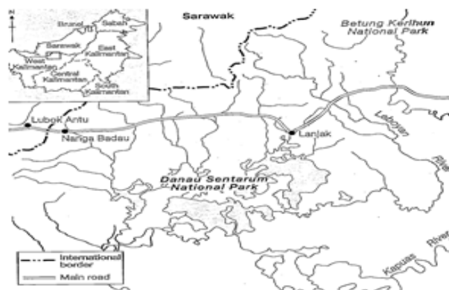
RAJAH 1. Peta lokasi sempadan Lubok Antu, Malaysia-Badau, Indonesia.