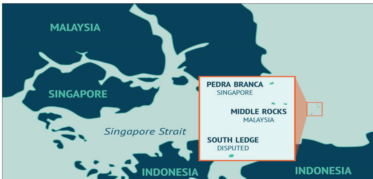
PETA 2. Pedra Branca, Middle Rocks dan South Ledge

Malaysia mengaplikasikan aspek sejarah sebagai salah satu prinsip dalam tuntutananya. Menurut Kuala Lumpur, hak dan kedaulatan ke atas Pedra Branca adalah secara semulajadi terletak dibawah bidangkuasa Kesultanan Johor menerusi prinsip time immemorial (wujud atau berterusan untuk masa yang lama sebelum undang-undang moden dipraktikkan) (International Court of Justice