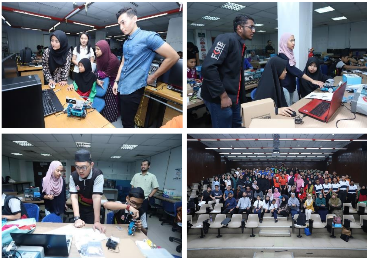
Rajah 2: Sesi pementoran bersama peserta pertandingan MakeX oleh pelajar prasiswazah yang terlibat