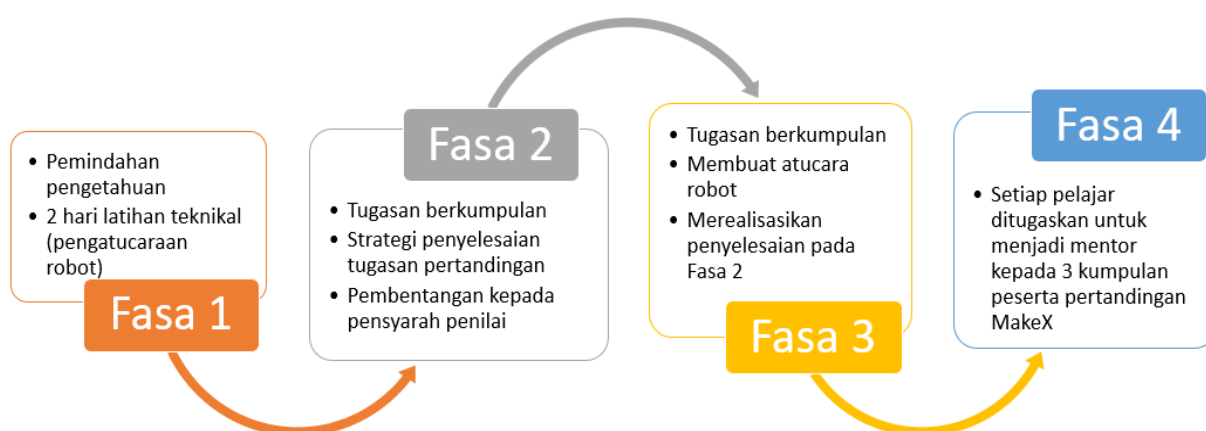
Rajah 1: Model dan struktur program pementoran STEM

Struktur program pementoran ini diolah oleh pensyarah CRYsTaL UKM dan melibatkan pelajar prasiswazah tahun dua dan tiga, dari program Kejuruteraan Elektrik dan Elektronik, UKM.